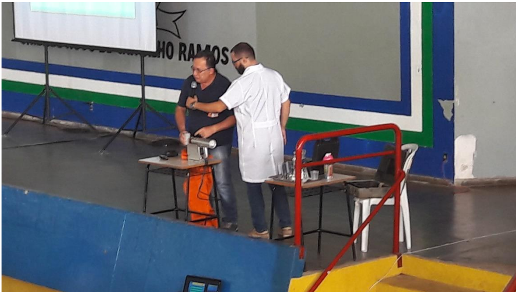
Figura 2 – Palestra de um representante da CNEM.