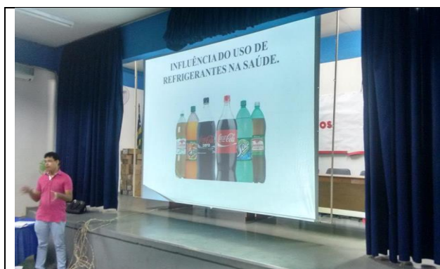
Introdução: A influência do uso de refrigerantes na saúde.