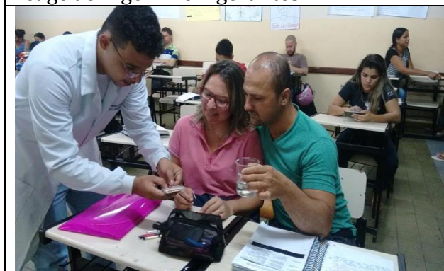
Observação do caráter ácido e básico no papel indicador.