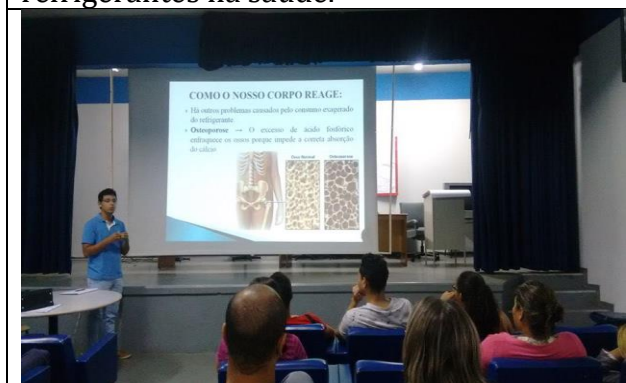
Bolsista explicando como o nosso corpo reage ao ingerir refrigerantes.