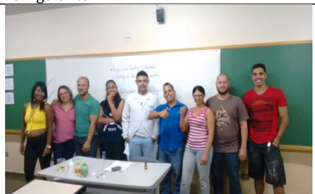
Bolsista e alunos após a realização da temática.