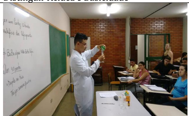
Reação do ferro metálico com o ácido do refrigerante.