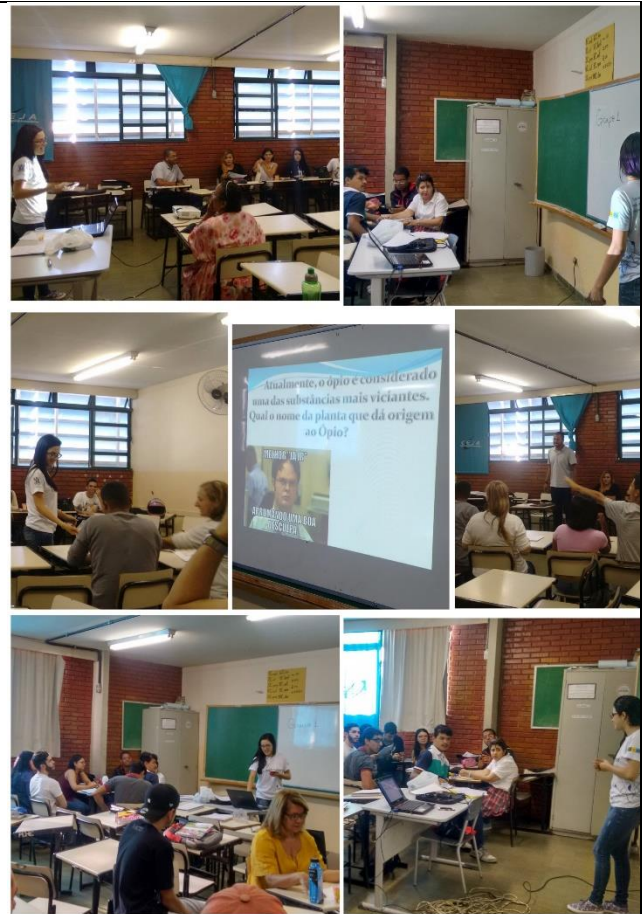
Fotos da terceira intervenção sobre a gincana de perguntas sobre drogas