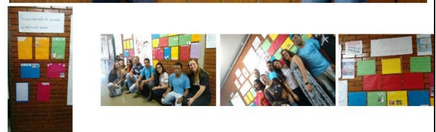
Fotos da quarta intervenção, enfatizando a aula experimental.