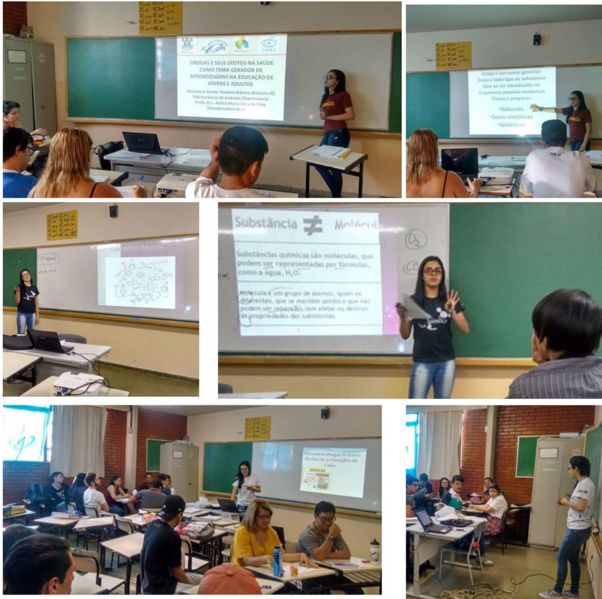
Fotos da primeira intervenção sobre a temática Drogas.