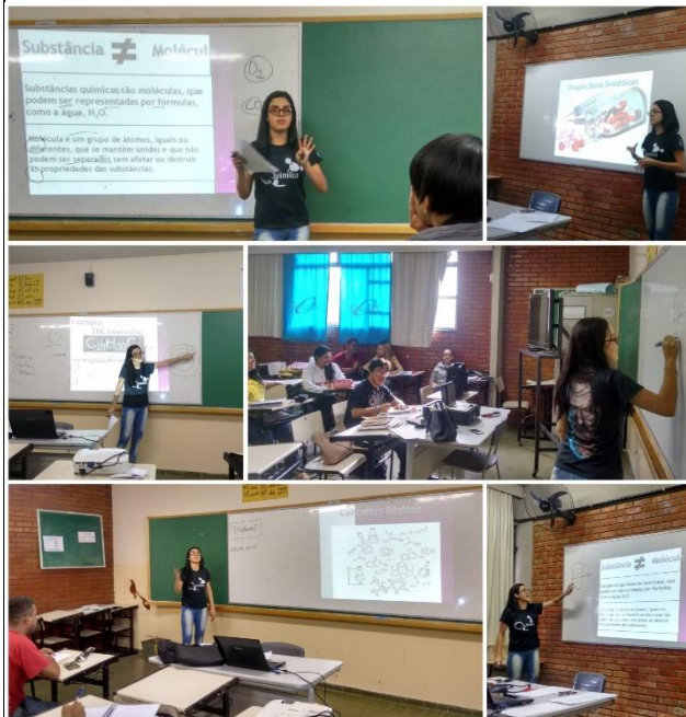
Fotos da segunda intervenção sobre as substâncias químicas presentes nas drogas.