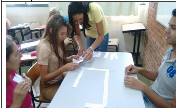
Explicação sobre as regras do jogo “Dominó orgânico”.