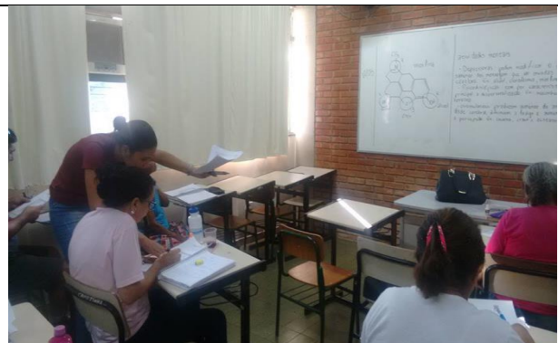
Bolsista auxiliando na resolução de exercícios.