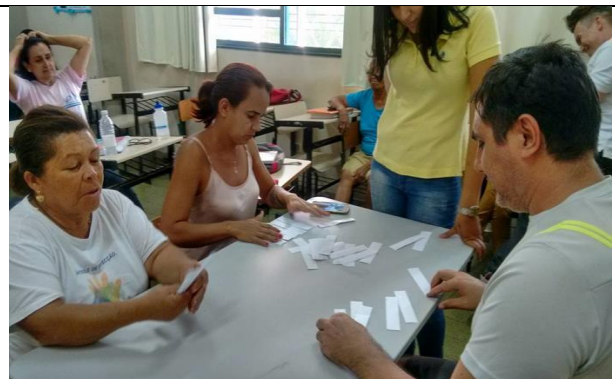
Alunos da turma 4ºM interagindo e jogando.