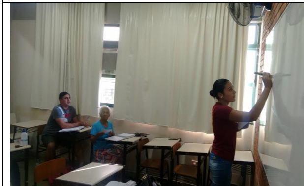
Bolsista desenhando o princípio ativo de diversas drogas e explicando os seus efeitos no corpo humano.