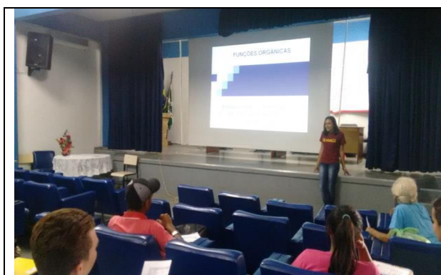
Bolsista explicando a importância do tema na turma 4ºM.