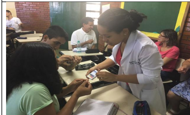
Bolsista mostrando tabela de identificação de pH a dois alunos da turma 3°F.