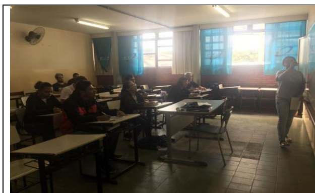
Apresentação do conteúdo na turma 2°C.