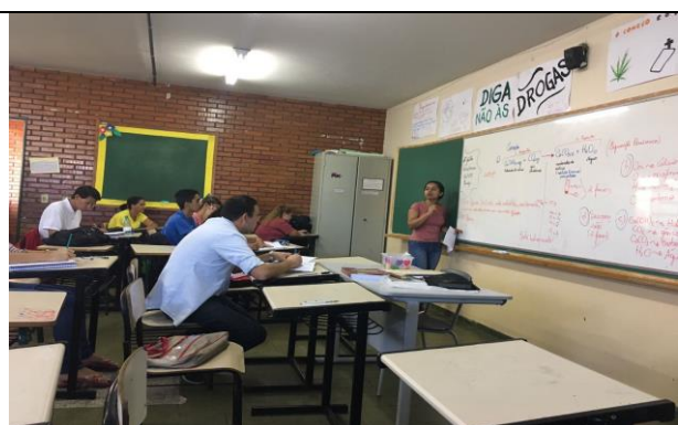
Correção dos exercícios realizados pelos alunos da turma 3°F