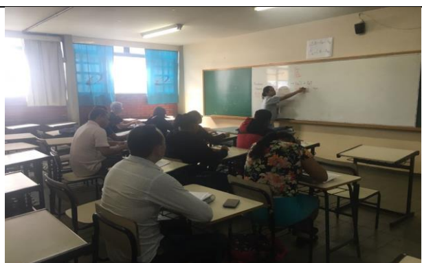
Resolução de exercícios e apoio pedagógico.