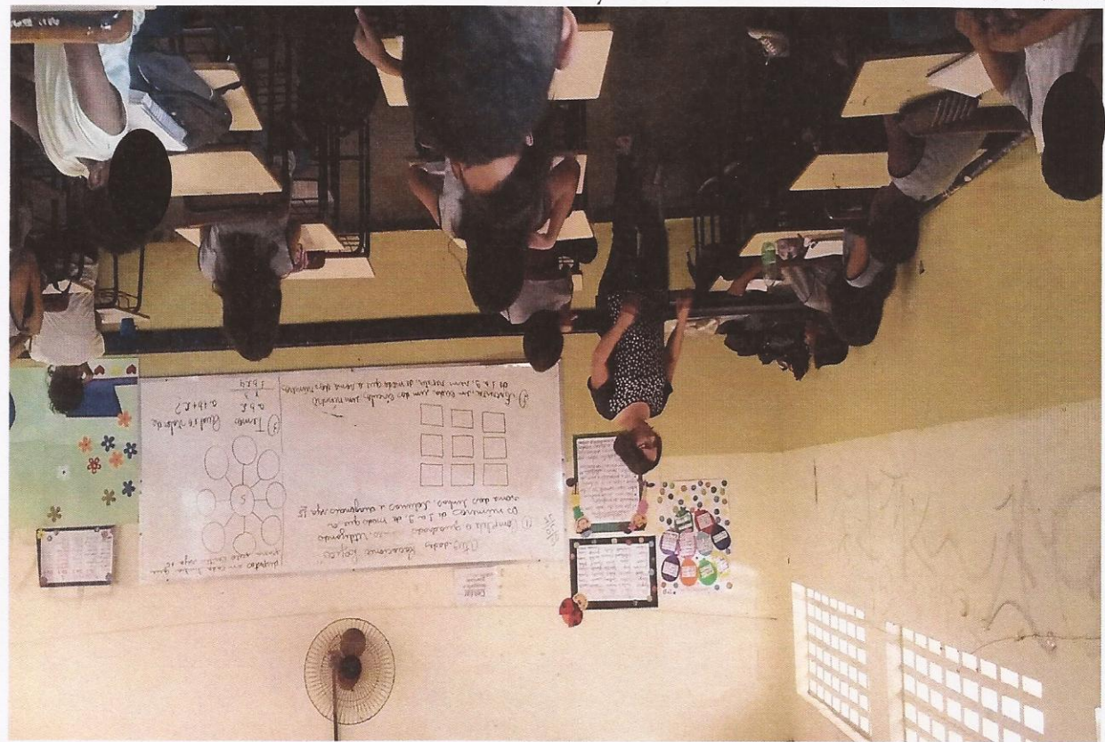
Realização da atividade QUADRADO MÁGICO.