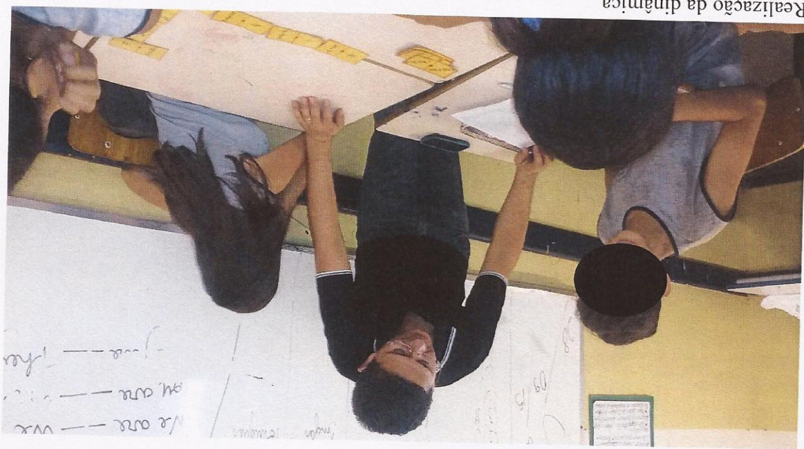
Realização da dinâmica.

tradicionais. - Avaliar a capacidade dos alunos em levantar questões, encontrar soluções e elaborar Referencial teórico: - MatemáticaInformaticaUepr, Jogos e Atividades referentes a equações de 1º grau. [online] Disponível na Internet via WWW. URL: http://matematicainformaticauepr.pbworks.com/w/page/44010807/Oficina (acesso em 29/11/2015) às 20h55min).